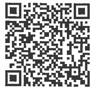
Pago en una sola exhibición

RECTORIA COMUNICACIÓN SOCIAL 15 JUN 2016 RECIBIDO